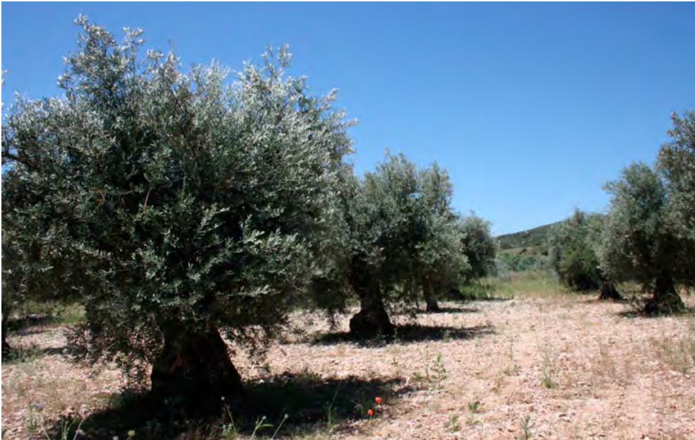
Plantación de olivar

Para aquellos casos en los que el cultivo del olivar se realice en regadío, es obligatorio disponer de sistemas de control de agua de riego que garanticen una información precisa sobre los caudales de agua efectivamente utilizados.