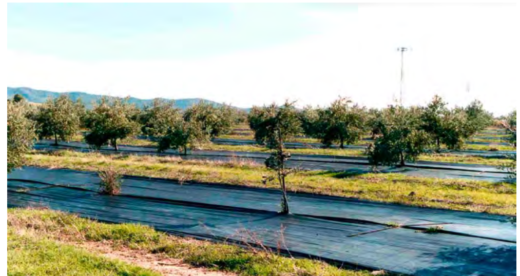
Cubierta en plantación de olivar

Mantener una cubierta vegetal de anchura mínima de 1 m en las calles transversales a la línea de máxima pendiente, en el caso de olivar con pendiente igual o superior al 10%, en el que se mantenga el suelo desnudo en los ruedos de los olivos mediante la aplicación de herbicidas. En caso de no poder establecerse de manera transversal debido al sistema de riego o el diseño de la parcela, se colocará paralelamente a la línea de máxima pendiente.