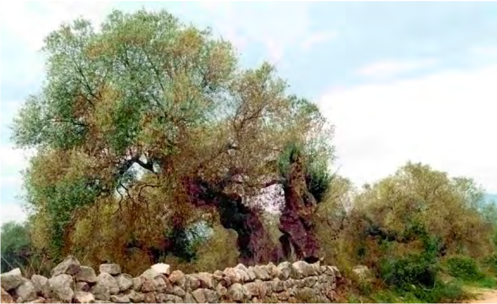
Muro de piedra seca

Se consideran elementos estructurales aquellas particularidades del terreno tales como: