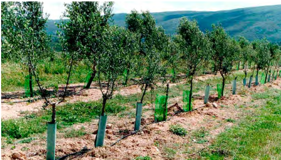
Plantación joven con protectores y riego localizado