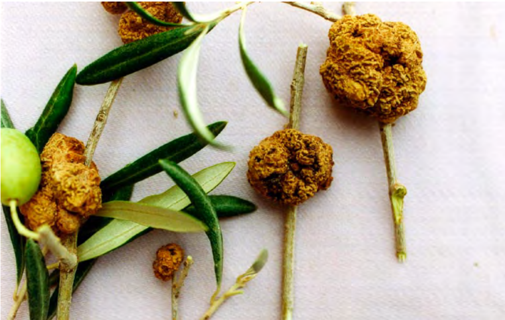
Frutos afectados por tuberculosis