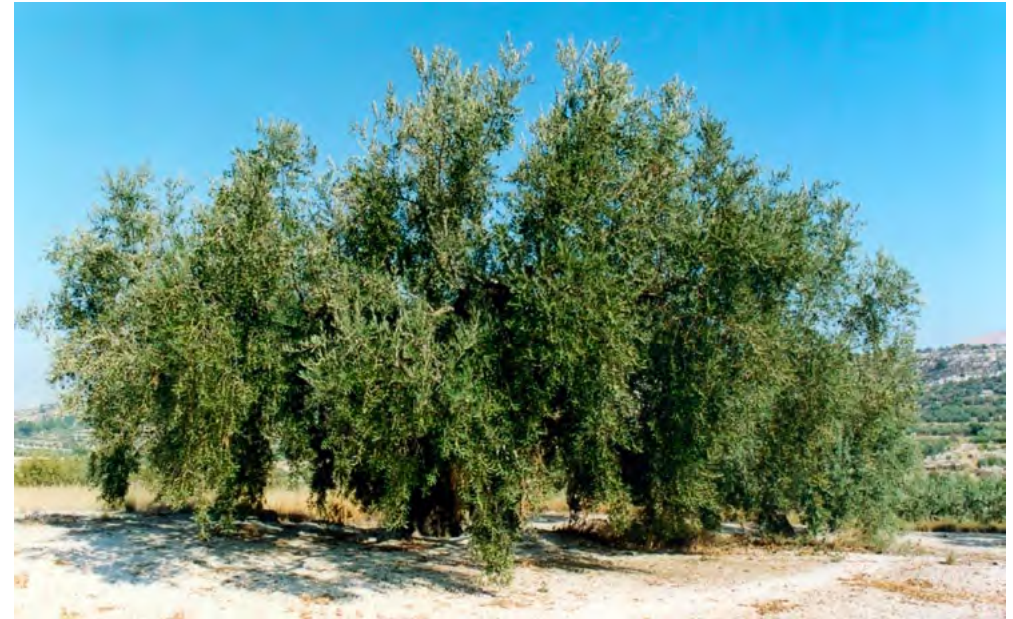
Árboles con buena relación hoja/madera