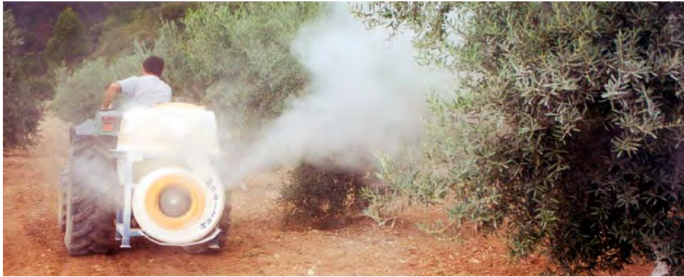
Control del repilo mediante el uso de caolines