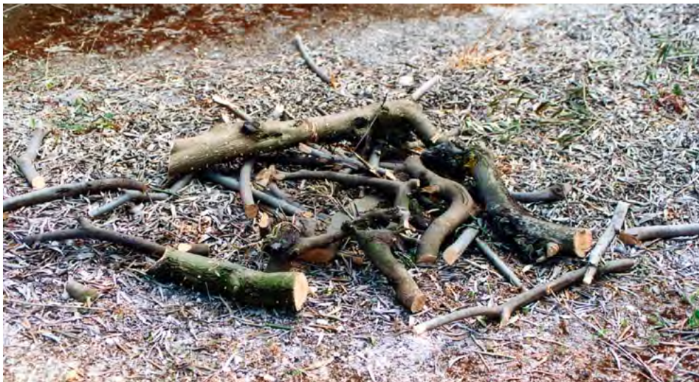
Utilización de troncos trampa para el control del barrenillo

El seguimiento de estas obligaciones y recomendaciones facilita el cumplimiento de: