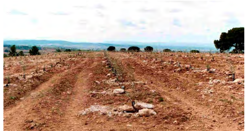
Uso de aperos de dientes