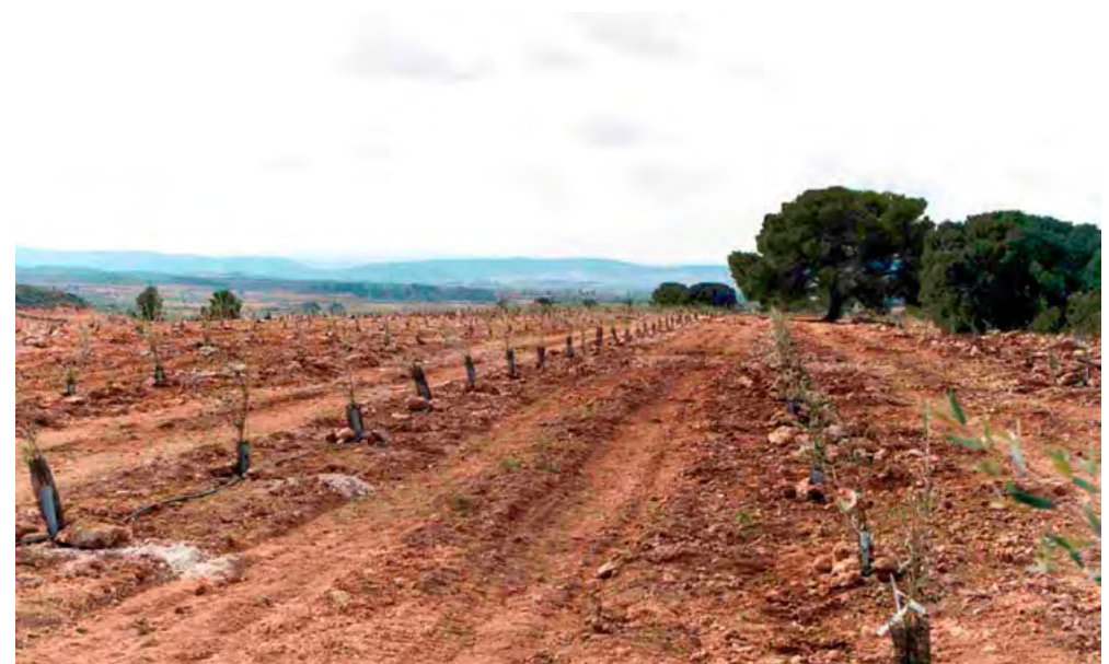
Plantación joven con protectores y riego localizado

El seguimiento de estas recomendaciones facilita el cumplimiento de: