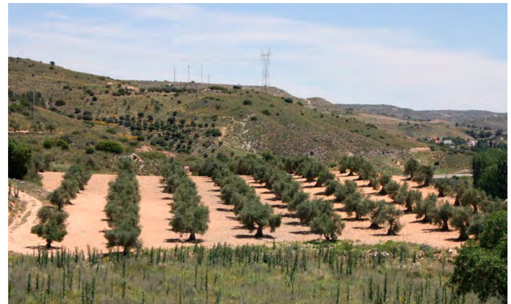
Plantación en marco rectangular