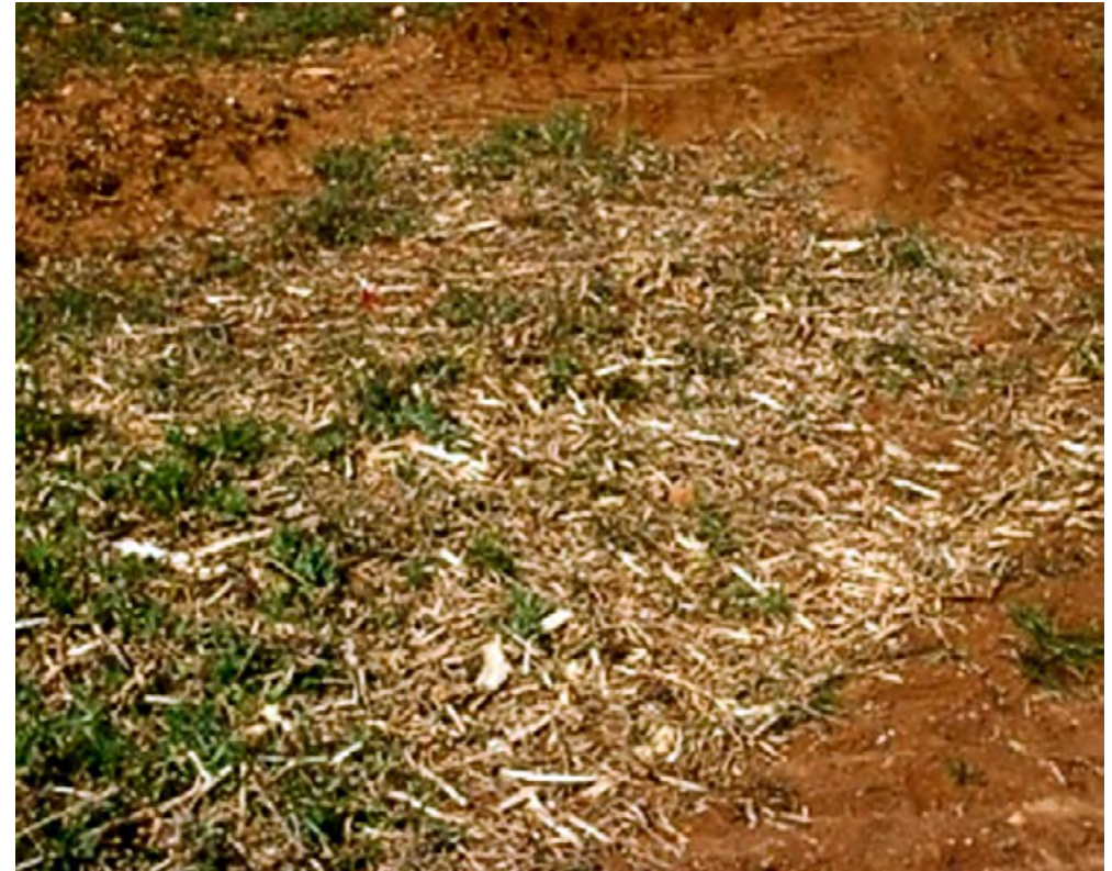
Triturado de restos de poda sobre el terreno