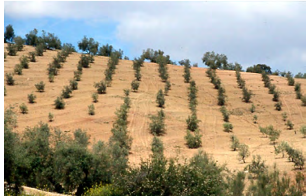
Diseño de plantación en recintos con pendientes pronunciadas