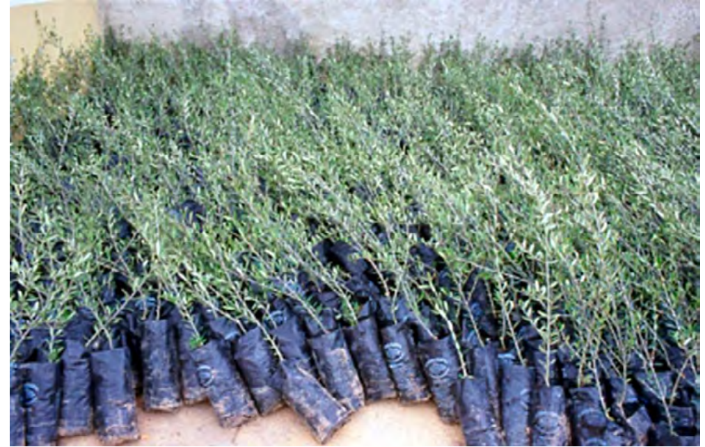
Material vegetal certificado con las garantías sanitarias legales