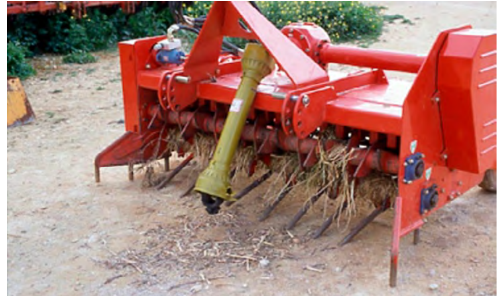
Apero de dientes