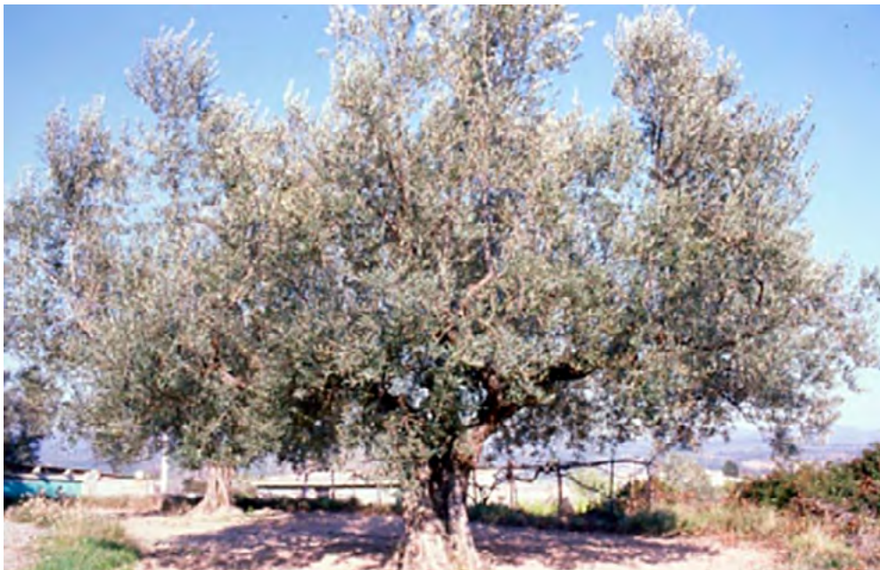
Árbol adulto en el que se ha realizado una poda equilibrada

En cuanto a la gestión de los restos de poda, se recomienda tener en cuenta los siguientes aspectos: