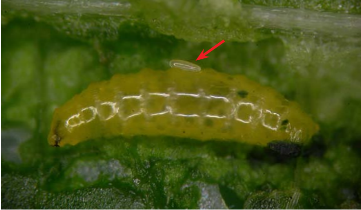
Huevo de Diglyphus isaea sobre larva de L. trifolii

Ciclo biológico de Diglyphus isaea en el interior de la galería