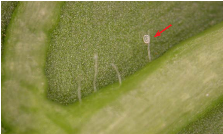
Hoja de pimienta con huevos Amblyseius swirskii

A. swirskii se refugia en las zonas de mayor humedad de la hoja