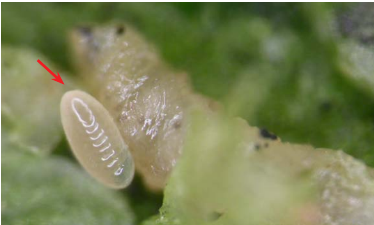
Larva de Diglyphus isaea sobre larva de L. bryoniae

La hembra de D. isaea realiza la puesta en el interior de la galería, sobre la larva del minador (ectoparasitoide)