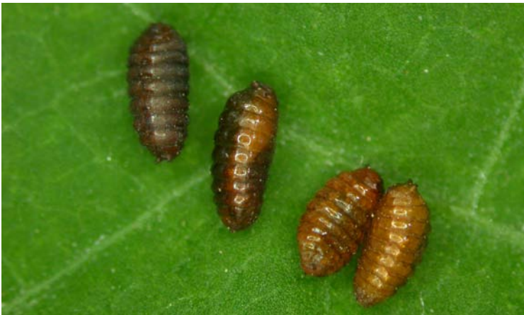
Pupas de Liriomyza bryoniae