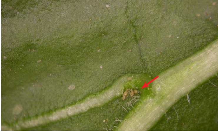
Hoja de pimienta con Amblyseius swirskii