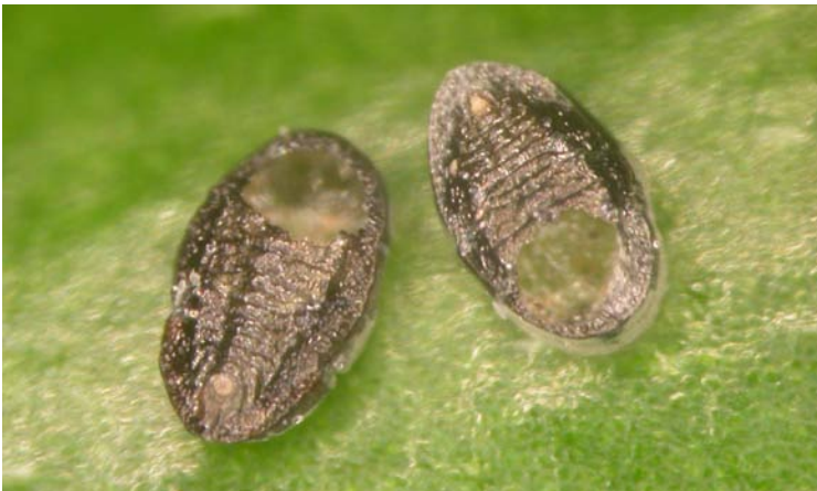
Exuvia de T. vaporariorum parasitada por E. formosa