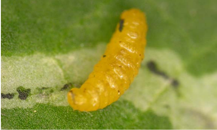
Larva de Liriomyza trifolii