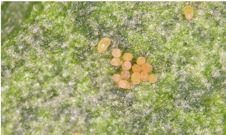
Puesta de Bemisia tabaci