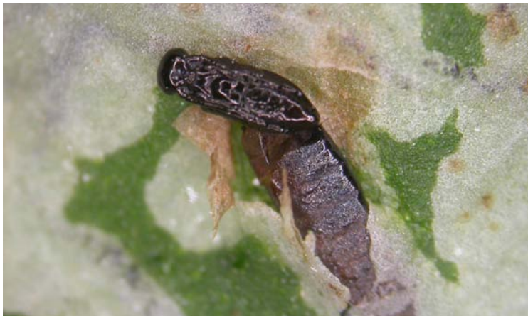
Pupa de C. formosa extraída bajo lupa del interior de la larva del minador