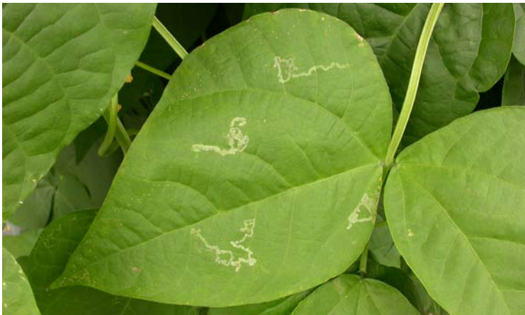
Galerías de Liriomyza trifolii en cultivo de judía