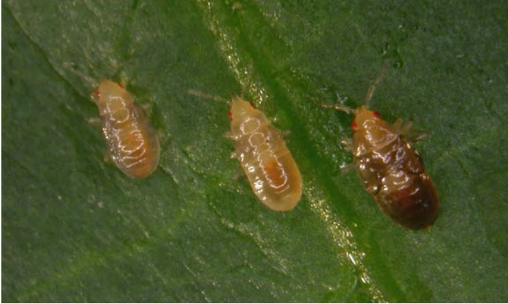
Ninfas II, III y IV de Orius laevigatus