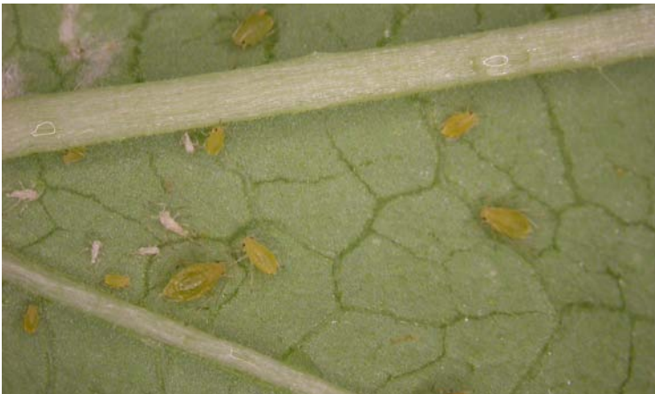
Colonia de Myzus persicae