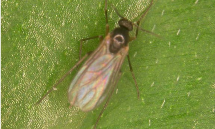
Adulto de Bradysia sp. "mosca esciárida"