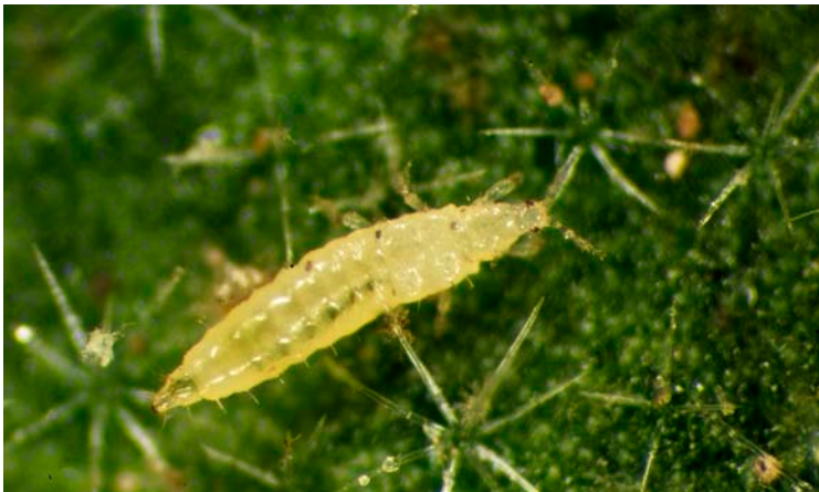
Larva de Frankliniella occidentalis

Alas estrechas con largas sedas marginales