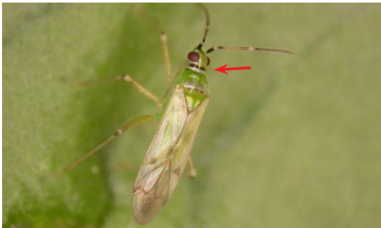
Adulto de Nesidiocoris tenuis