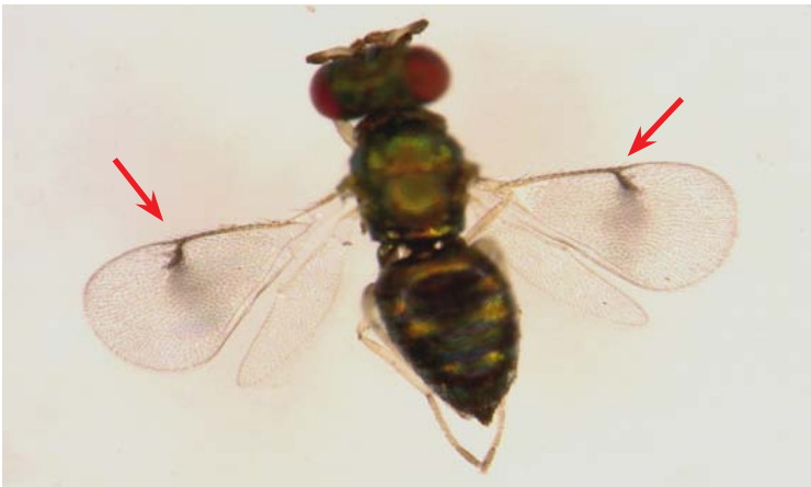
Adulto de Chrysonotomyia formosa

Color del cuerpo negro, con reflejos dorados