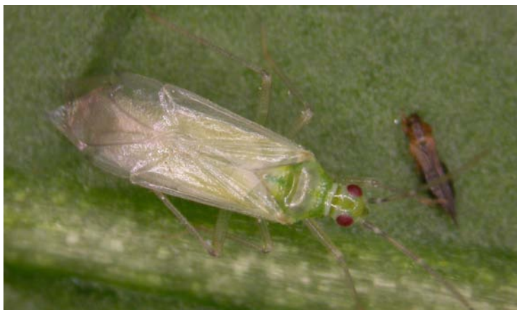
Adulto de Nesidiocoris tenuis