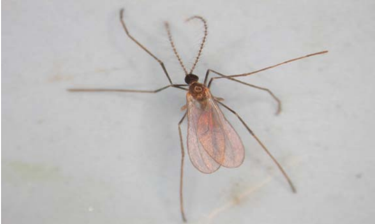
Adulto de Aphidoletes aphidimyza