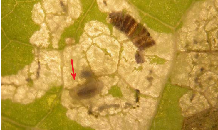
Larva de C. formosa fuera de la larva del minador (visible en campo)

En otras ocasiones, C. formosa desarrolla los últimos estadios de larva y pupa fuera de la larva del minador