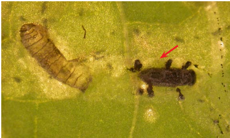
Pupa de Chrysonotomyia formosa (visible en campo)