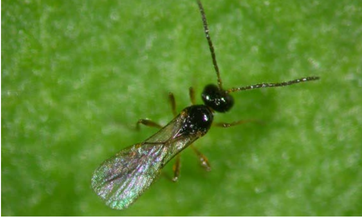
Adulto de Aphidius colemani