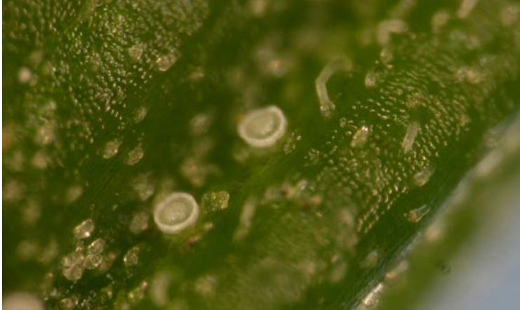
Huevos de Orius laevigatus en pimiento