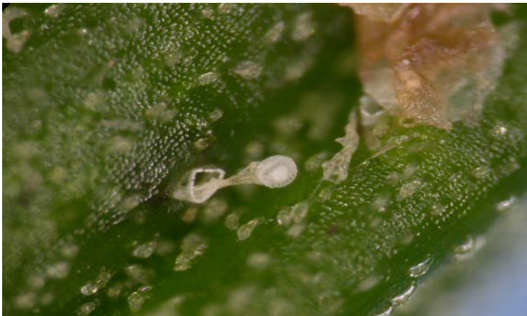
Huevo eclosionado de Orius laevigatus

Los huevos están insertados en el tejido vegetal. Sólo es visible el extremo del huevo