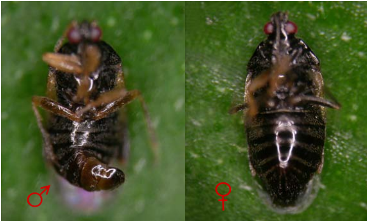
Adultos macho y hembra de Orius laevigatus (vista ventral)

Depredador polífago que también se alimenta de polen