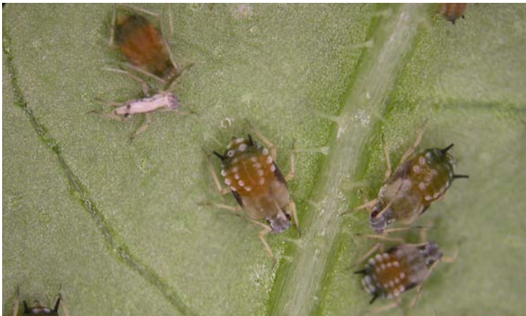
Colonia de Aphis gossypii