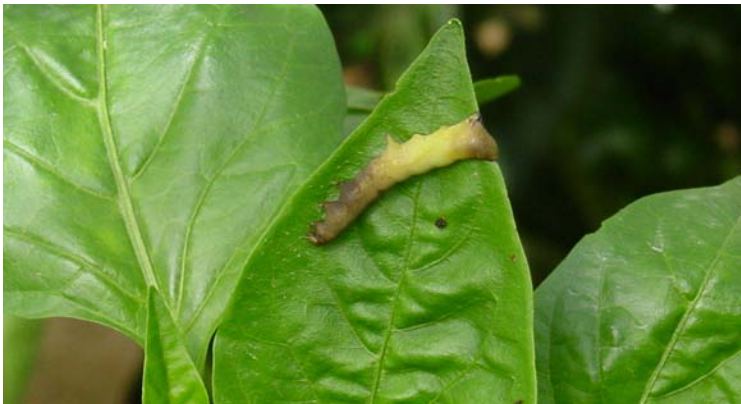
Larva de Spodoptera exigua afectada por el Se MNPV