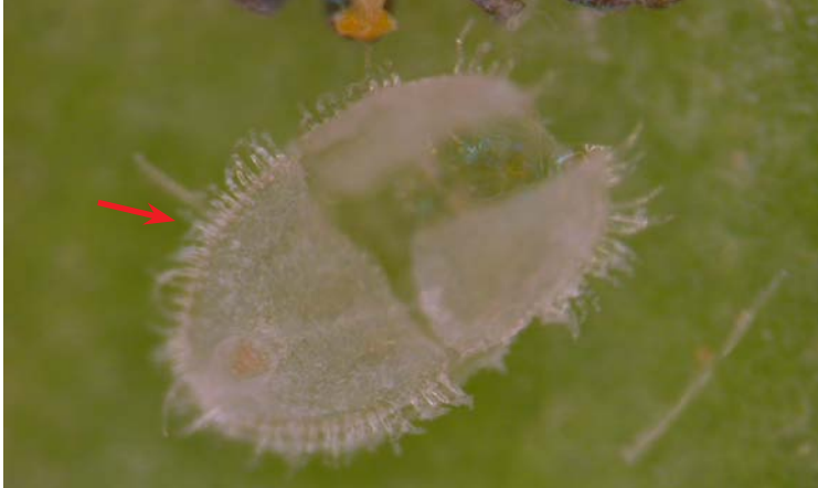
Exuvia de Trialeurodes vaporariorum