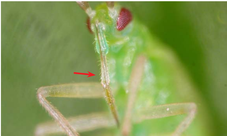
Detalle del estilete de Macrolophus caliginosus

Depredador polífago con régimen alimenticio mixto, zoófago y fitófago