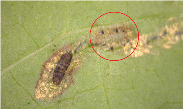
Larva de minador parasitada por Diglyphus isaea

Color del cuerpo negro con reflejos verdes metálicos