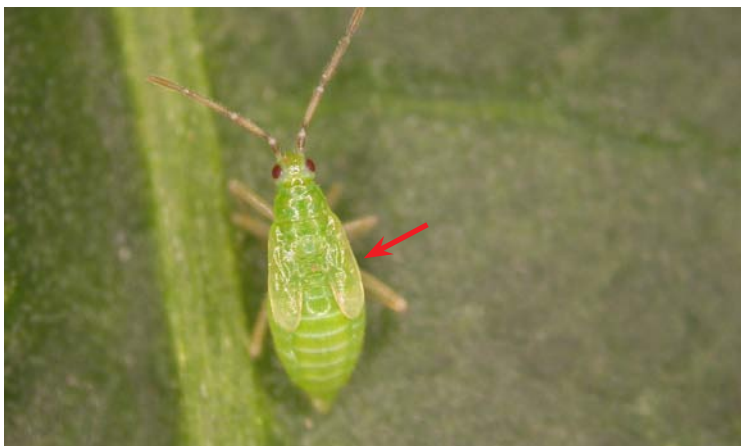
Ninfa de Nesidiocoris tenuis

Anillo negro en el borde posterior de la cabeza. Depredador polífago con régimen alimenticio mixto, zoófago y fitófago