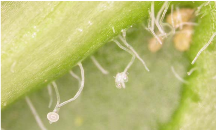
Huevos y adultos de Amblyseius swirskii

Depredador polífago que también se alimenta de polen