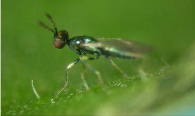
Adulto de Diglyphus isaea (ectoparasitoide)