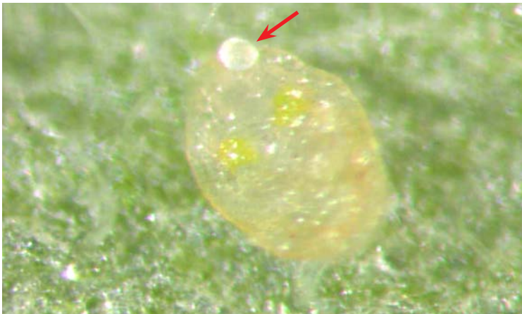
Ninfa de Bemisia tabaci con huevo de Eretmocerus mundus

Color del cuerpo amarillo. Alas transparentes con reflejos metálicos