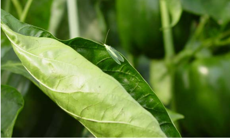
Adulto de Chrysoperla carnea