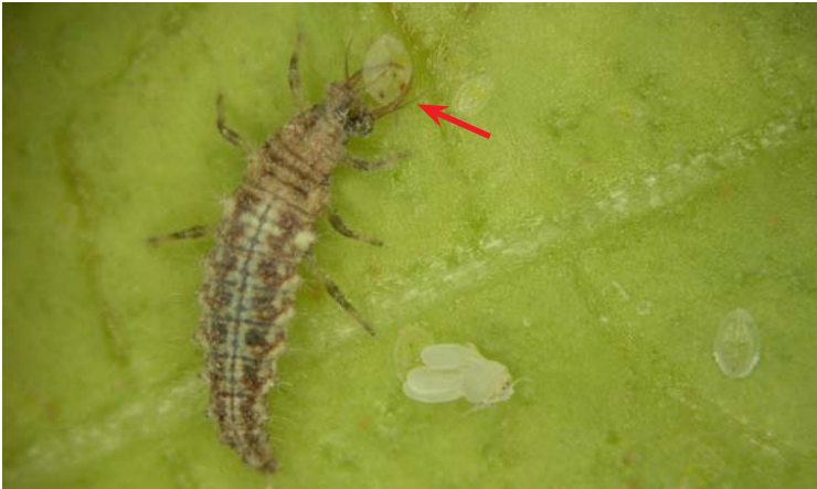
Larva de Chrysoperla carnea