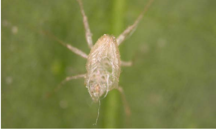
Muda de Nesidiocoris tenuis