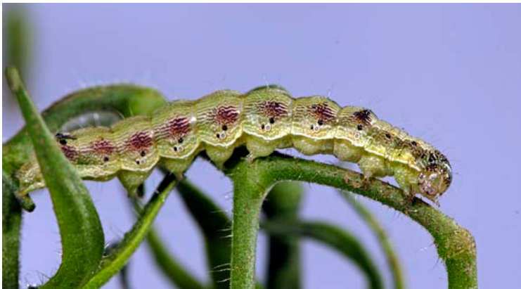
Larva de Helicoverpa armigera "Heliiothis"