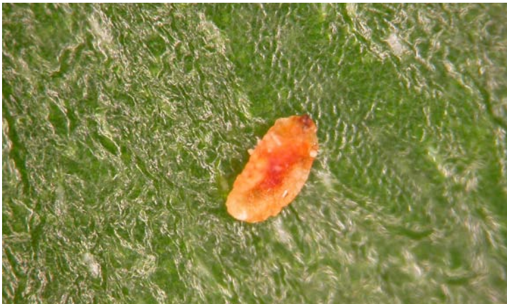
Larva de Feltiella acarisuga

Los adultos no son depredadores, pero son capaces de detectar en vuelo los focos de la araña roja