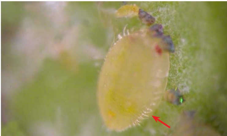
Pupa de Trialeurodes vaporariorum