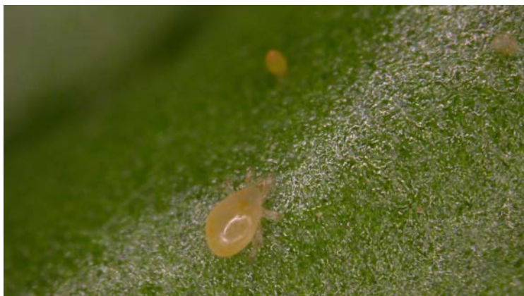
Adulto de Amblyseius californicus