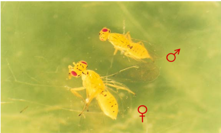
Hembra (inferior) y macho (superior) de Cirrospilus vittatus

Color amarillo característico. Grandes ojos rojos