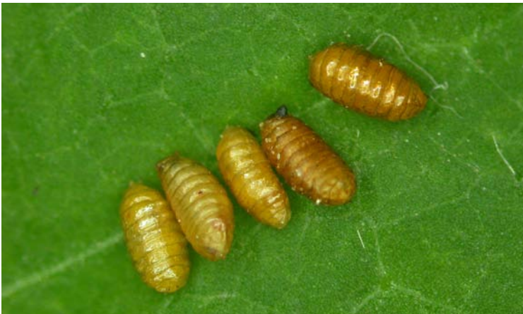
Pupas de Liriomyza trifolii

Colaboración del cuerpo amarillo intenso