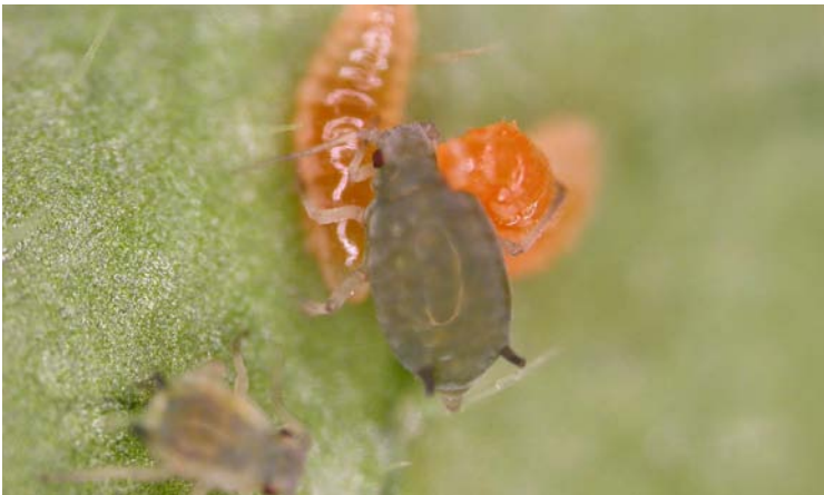
Larva de Aphidoletes aphidimyza depredando a un pulgón

Los adultos son excelentes buscadores de las colonias de pulgones, pero no son depredadores