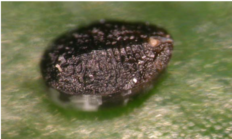
Pupa de T. vaporariorum parasitada por E. formosa

La hembra presenta la cabeza y el tórax negro y el abdomen amarillo