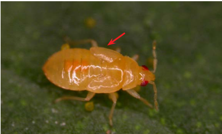
Ninfa V de Orius laevigatus

Las ninfas de O. laevigatus también son depredadoras