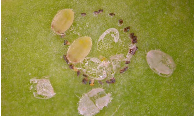
Ninfas, huevos y exuvias de Trialeurodes vaporariorum