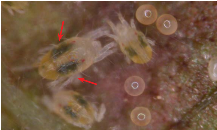
Colonia de Tetranychus urticae

La coloración de T. urticae varía dependiendo del cultivo sobre el que se desarrolle