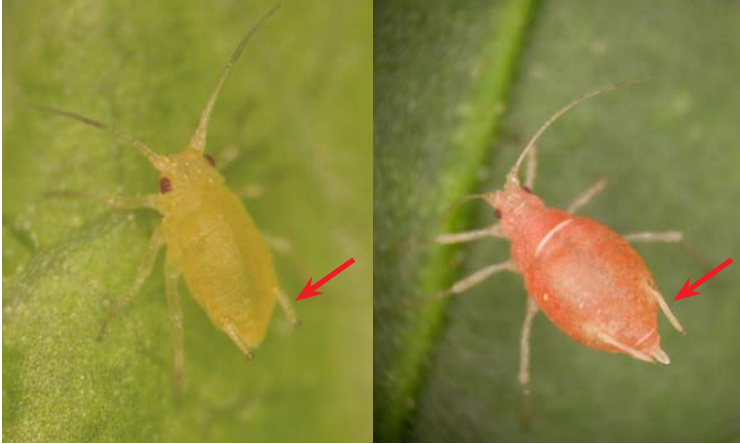
Adulto áptero (sin alas) de Myzus persicae