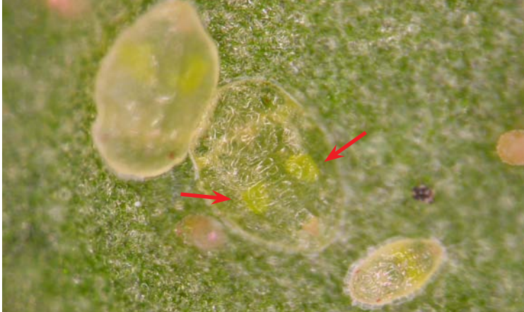
Ninfas de Bemisia tabaci