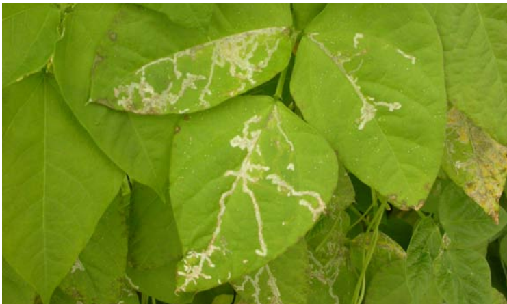
Galerías de Liriomyza bryoniae en cultivo de judía

Color amarillo en su parte anterior y color blanco en su parte posterior