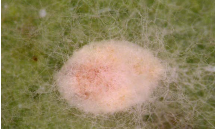
Ninfa de mosca blanca infestada por Lecanicillium lecanii