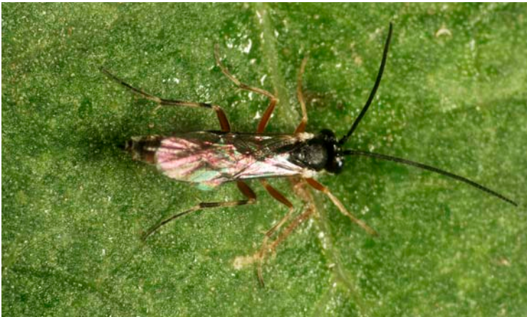
Adulto de Hyposoter didymator