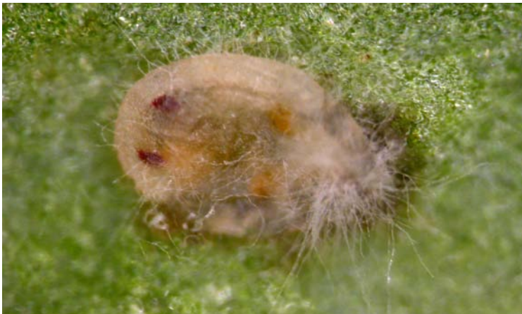
Ninfa de mosca blanca infestada por Beauveria bassiana