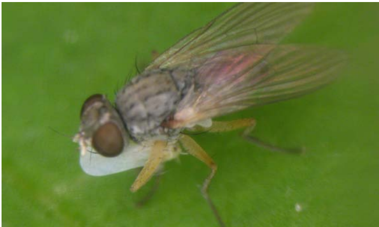
Mosca tigre depredando a un adulto de mosca blanca

La mosca tigre es depredador polífago, tanto en estado larvario como en estado adulto