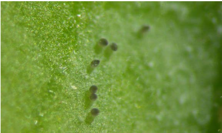
Adulto de Trialeurodes vaporariorum