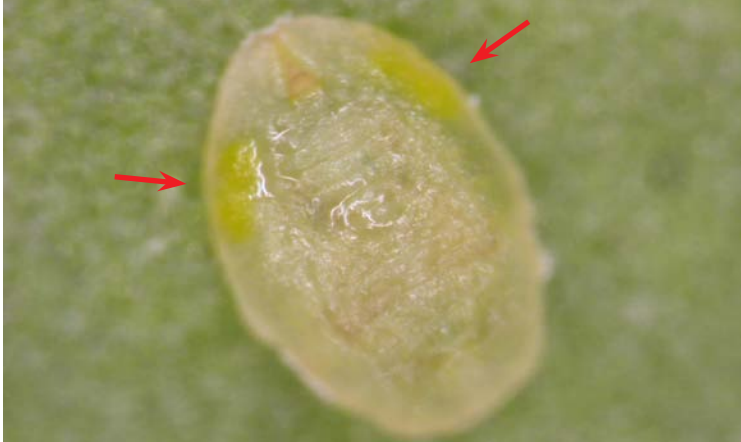
Ninfa de Bemisia tabaci parasitada por Eretmocerus mundus