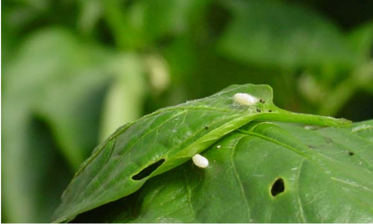
Pupa de Cotesia sp.