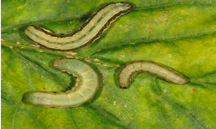
Larvas de Spodoptera exigua "Rosquilla verde"