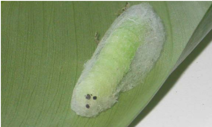
Inicio de la fase de pupa de Plúsid

Coloración verde claro a muy claro. Por su forma de m overse, se les conoce como medidores