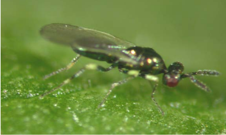
Adulto de Diglyphus minoeus