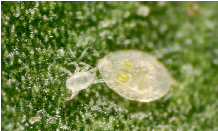
Amblyseius swirskii depredando a una ninfa de mosca blanca

Depredador polífago que también se alimenta de polen