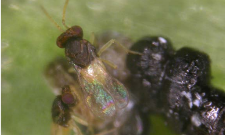
Adultos de Encarsia formosa recién emergidos de las pupas