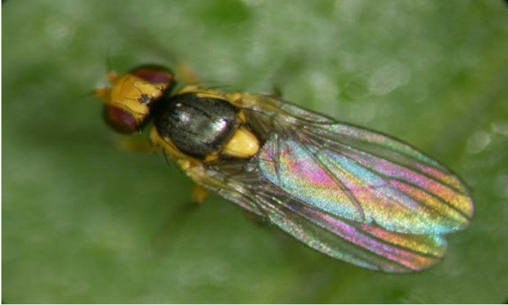
Adulto de Liriomyza trifolii