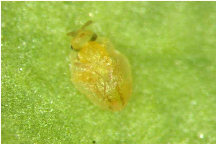
Adulto de Eretmocerus mundus emergiendo de la pupa