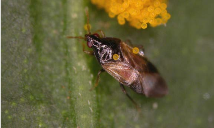
Adulto de Orius laevigatus