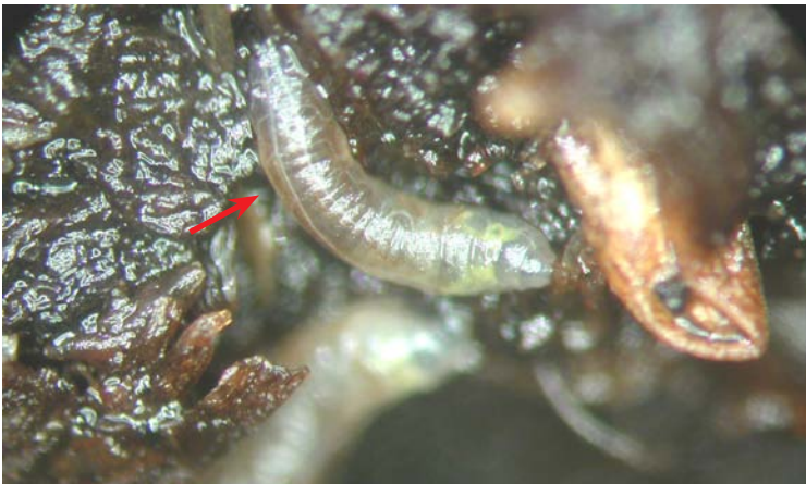
Larva de Bradysia sp. en suelo

Los adultos son mosquitos negros grisáceos con largas antenas