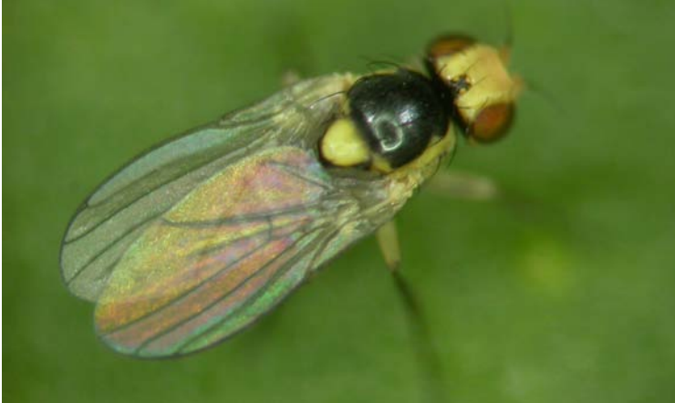
Adulto de Liriomyza bryoniae