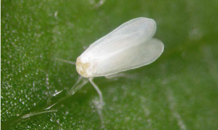
Adulto de Trialeurodes vaporariorum