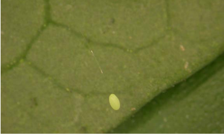
Huevo de Chrysoperla carnea