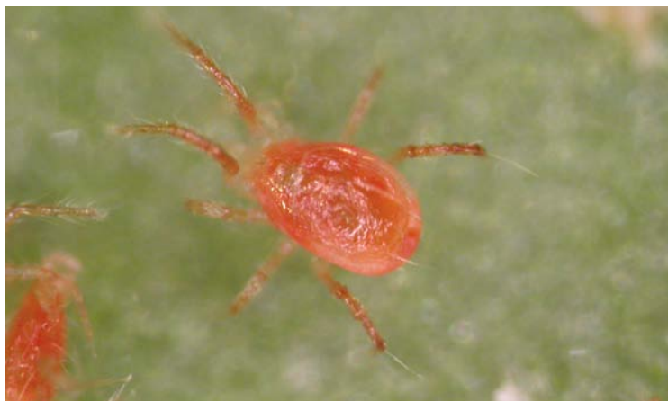
Adulto de Phytoseiulus persimilis