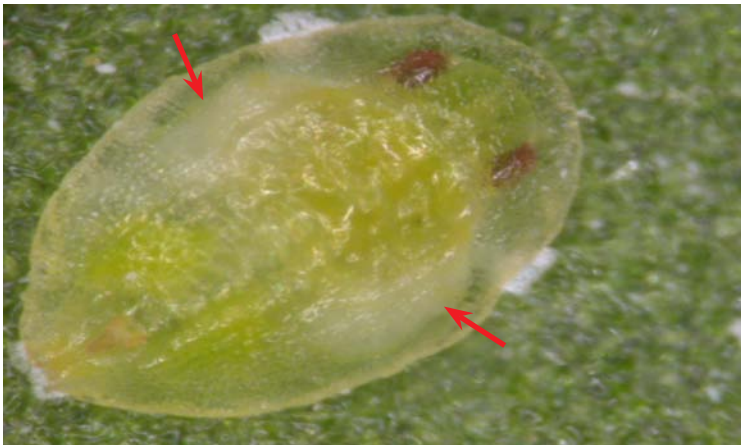
Pupa de Bemisia tabaci

Forma ovalada, globosa en los últimos estadios. Micetomas simétricos respecto al eje longitudinal el cuerpo