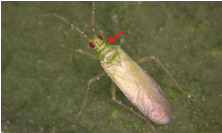
Adulto de Nesidiocoris tenuis

Las ninfas pasan por cinco estadios, realizando al final de cada uno de ellos una muda