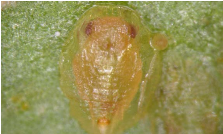
Pupa de Eretmocerus mundus

Micetomas desplazados respecto a su posición original