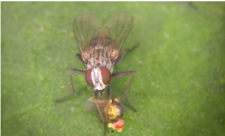
Adulto de Coenosia attenuata depredando a un adulto de minador