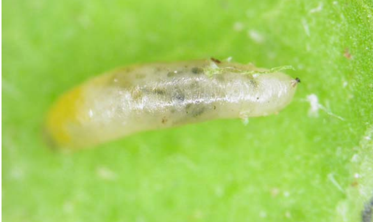
Larva de Liriomyza bryoniae