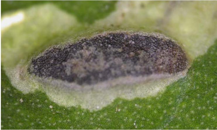
Larva de C. formosa dentro de la larva del minador (visible en campo)

A veces, C. formosa se desarrolla completamente dentro de la larva del minador hasta la emergencia del adulto