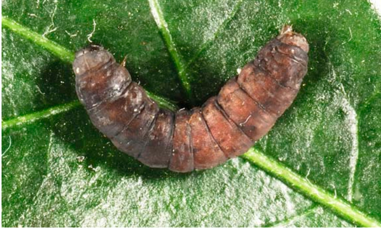
Larva de oruga afectada por Bacillus thuringiensis