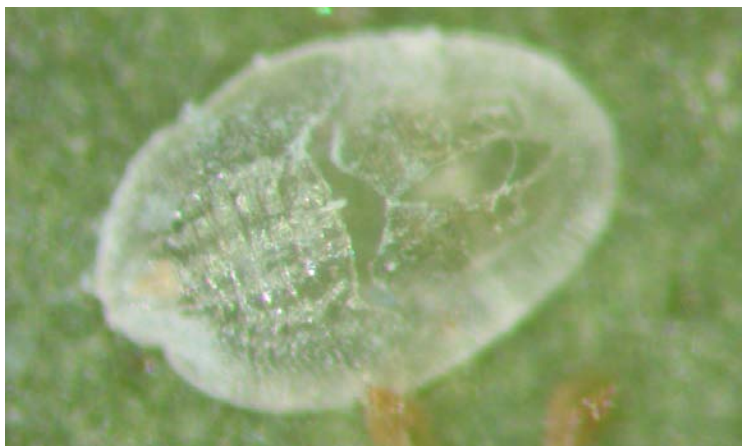
Exuvia de Bemisia tabaci