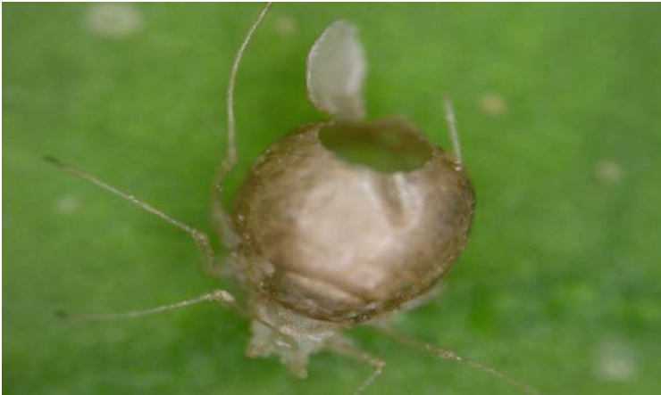
Momia del pulgón parasitado de Aphidius colemani

Adultos de color negro con largas antenas. La hembra de A. colemani realiza la puesta en el interior del cuerpo del pulgón