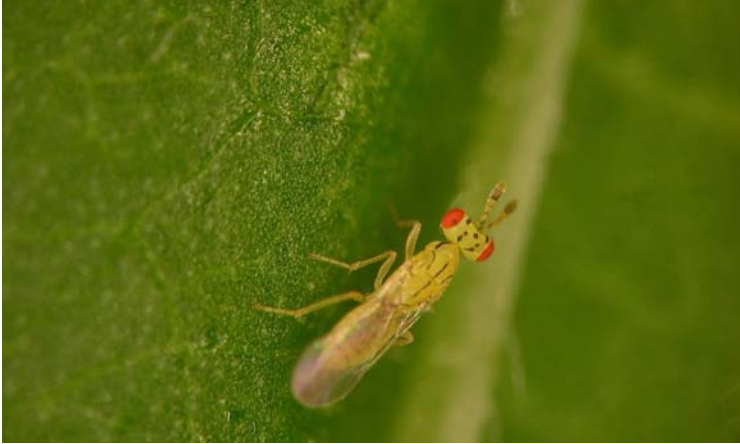
Adulto de Cirrospilus vittatus