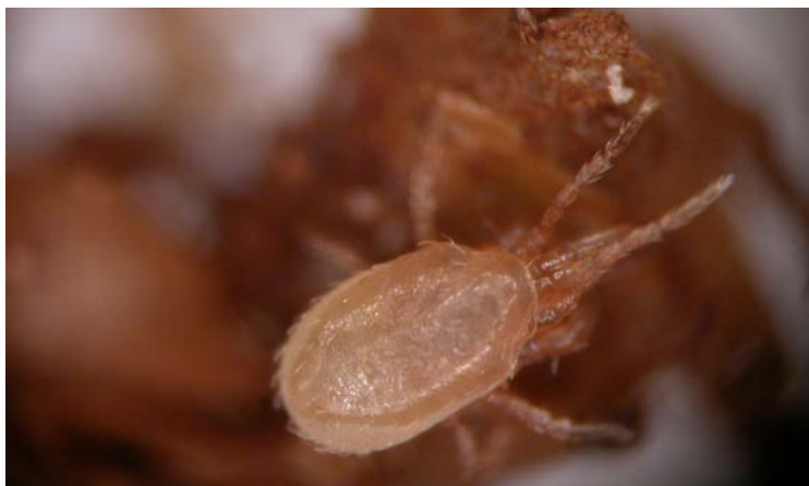
Adulto de Hypoaspis miles